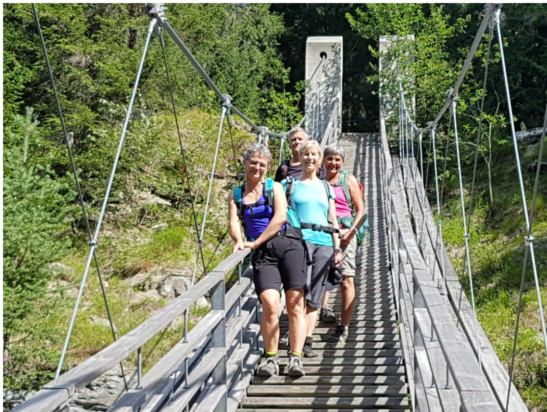
(der Traversina-Steg, eine kühne Brückenkonstruktion von 57m Spannweite)