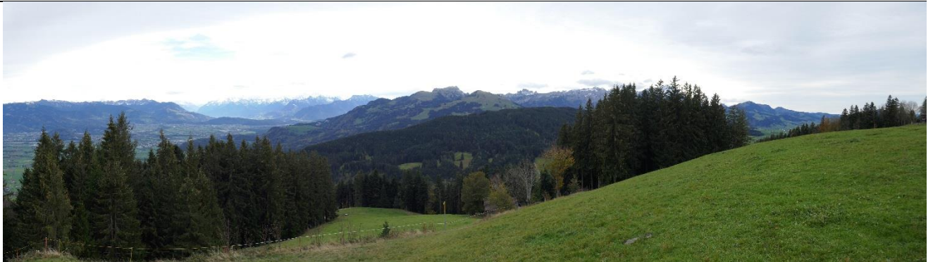
Welch ein Ausblick ...