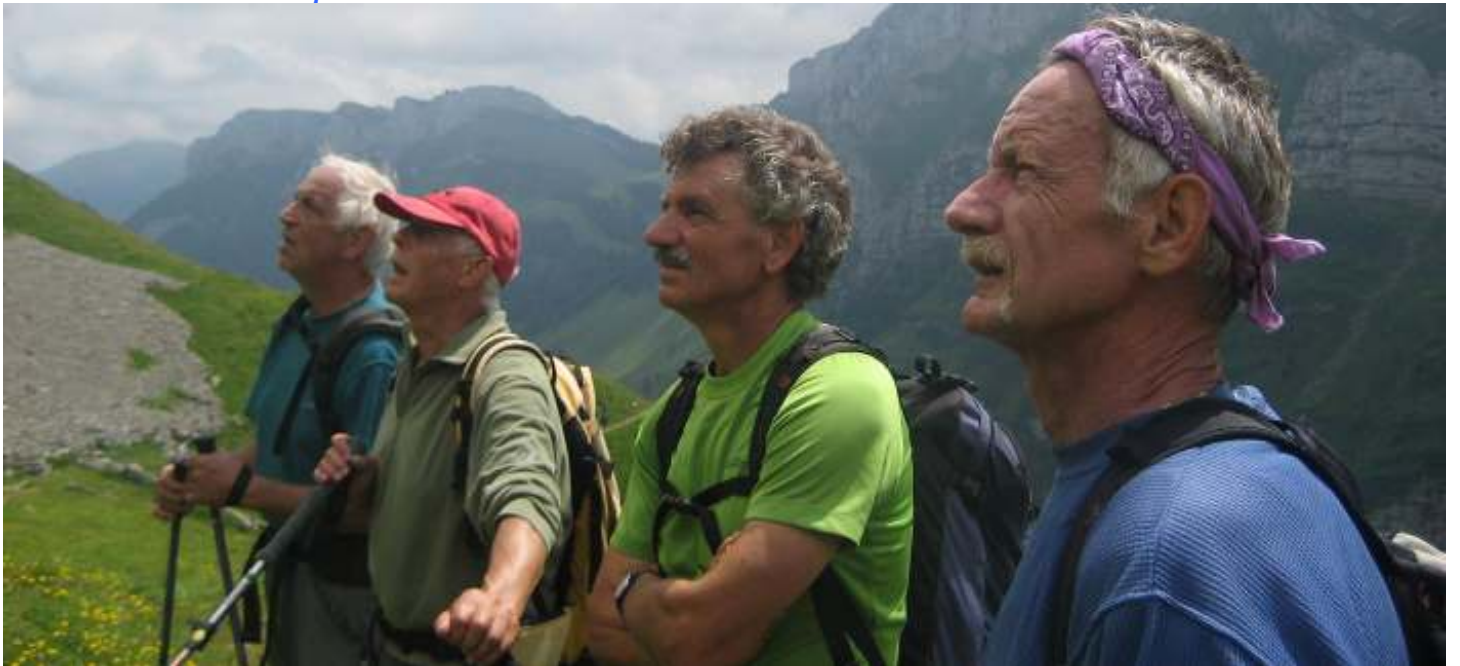
. . . und hinauf zu leuchtenden Feuerlilien !