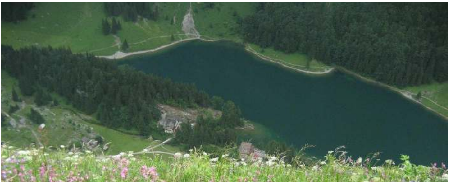
Blick hinunter zum Seealpsee . . .